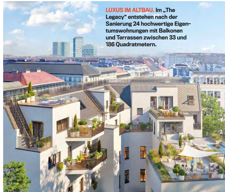
LUXUS IM ALTBAU. Im „The Legacy“ entstehen nach der Sanierung 24 hochwertige Eigentumswohnungen mit Balkonen und Terrassen zwischen 33 und 186 Quadratmetern.